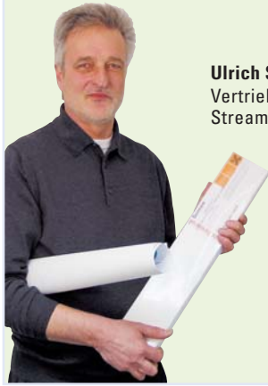
Ulrich Schmidt Vertrieb Streamline